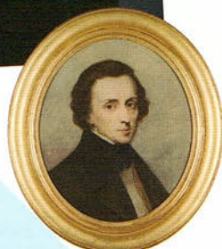
アリ・シェフェール 《フリデリク・ショパンの肖像》1847 ドルトレヒト美術館 Dordrechts Museum

高度なテクニックと美しい音色、そして深い楽曲理解で国内外で注目を浴びている小菅優（ピアノ）と石坂団十郎（チェロ）による珠玉のデュオ・リサイタル。繊細なショパンのプログラムをお楽しみいただく。