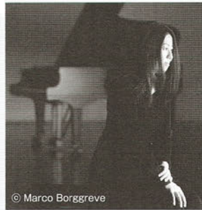
小菅優(ピアノ) Yu KOSUGE (Pf.)

高度なテクニックと美しい音色、若々しい感性と深い楽曲理解で最も注目を浴びている若手ピアニスト。9歳より演奏活動を開始し、2005年、カーネギー・ホールで、翌2006年には、ザルツブルク音楽祭でそれぞれリサイタル・デビュー。A.ドミトリエフ、C.デュトワ、小澤征爾、大植英次、R.ノリントン、S.オラモ等の指揮でベルリン